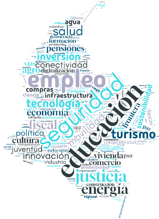
Gráfico 1. Nube de palabras