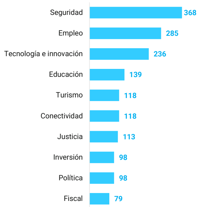
Gráfico 2. Top 10 temas en el discurso electoral (Número de apariciones).